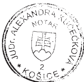
Bibiana Kapustová zamestnanec poverený notárom

Košice - mestská časť Juh dňa 27.01.2023